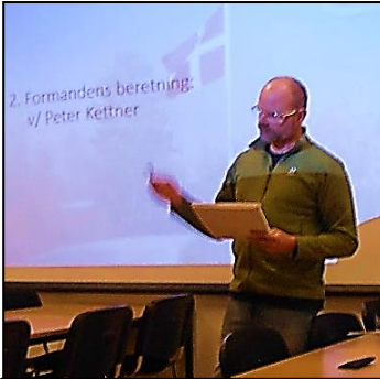
Formanden bød velkommen

Torsdag d. 5. marts var det igen tid til den årlige generalforsamling i Skamby og Omegns Borgerforening. Omkring 30 personer havde valgt at deltage i mødet.