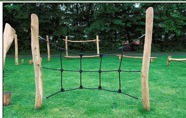
Billederne herover viser tre eksempler på, hvordan en tarzanbane kan udformes.