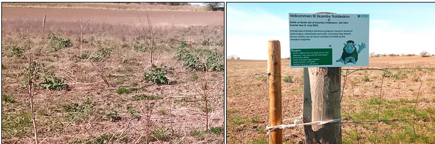
På billederne herover kan man se de små nye træer samt hegnet og skiltet, som er sat op ved skoven.